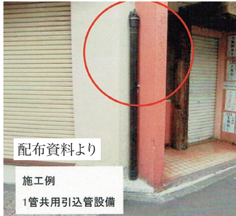
配布資料より 施工例 1管共用引込管設備

地への引込管の設置と、配線の接続になります。 今までは電柱から引つ張って、空中で建物に配線をつないでいたのですが、今後は地中から配管が引き込まれ、敷地内に引込管(写真参照)を立ち上げて、そこから配線を建物につなぐこととなります。