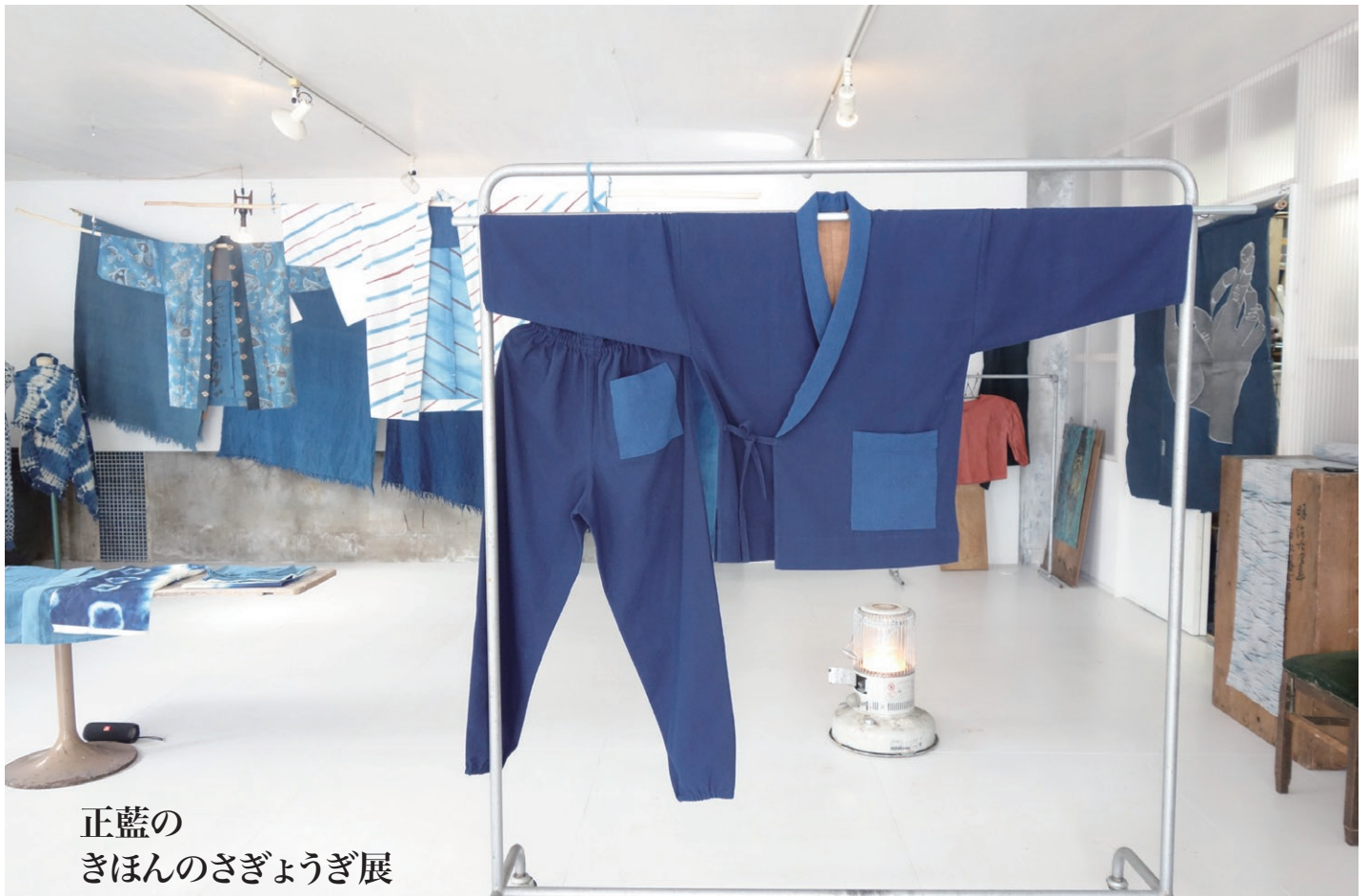
正藍の きほんのさぎょうぎ展

消火栓の位置を確認しながら、団員の方が道具を使って掘り返します。圧雪というよりは氷になっているので、砕いて取り除きます。